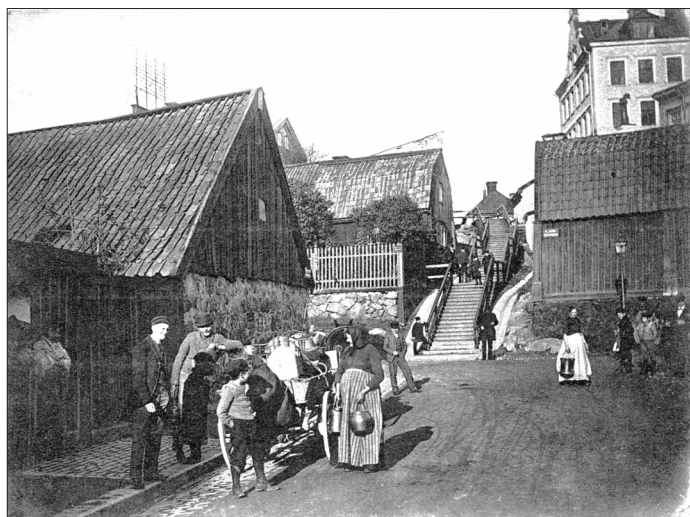
Tjärhovs tvärgränd, årtal 1895–1899

Vi besöker platser ur Per Anders Fogelströms roman och följer de platser och personer som Henning möter - det första hemmet, det första arbetet och den första kärleken. Vi får höra om framtida drömmar och om en flicka som heter Lotten. Vandringsen går på platser med backar och trappor. (Ö Södermalm, Skanstull via Vita Bergen till Fjällgatan) ca 2,5 km.